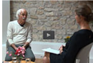
Sehprobe - Krebs in der Gynäkologie