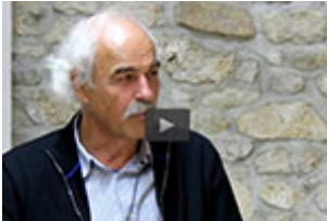
Sehprobe - Homöopathie und Wechseljahre