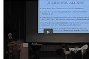
Sehprobe - Kinderhomöopathie-Kongress