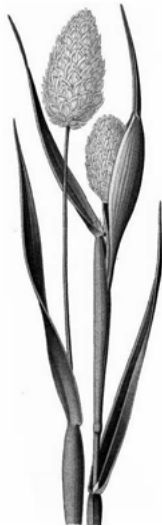
(1) Kanariengras ( Phalaris canariensis ).

Mit einem sehr einfachen Versuch zeigten Darwin und sein Sohn, dass diese Neigung nicht auf die Photosynthese zurückzuführen war, also den Prozess, durch den Pflanzen Licht in Energie verwandeln, sondern vielmehr auf eine der Pflanze innewohnende Bereitschaft, sich auf Licht zuzubewegen. Für ihren Versuch zogen Darwin Vater und Sohn mehrere Tage lang in einem völlig dunklen Raum in einem Topf Kanariengras ( Phalaris canariensis ). Dann zündeten sie etwa zwölf Fuß von dem Topf entfernt eine sehr kleine Gaslampe an und hielten das Licht so schwach, dass sie »die Sämlinge selbst nicht sehen ... noch eine Bleistiftlinie auf